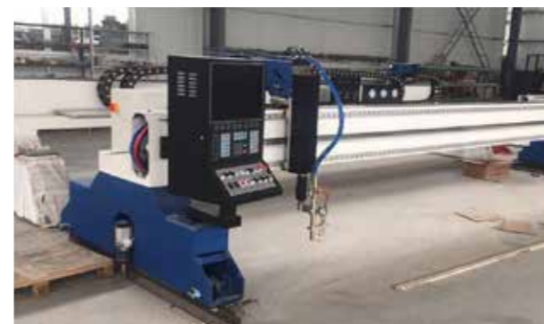
CNC PLASMA CUTTING MACHINE CNCプラズマと酸素ガス切断機