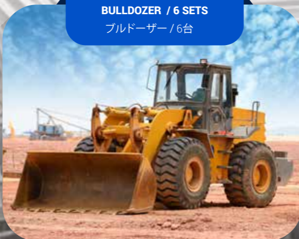
BULLDOZER / 6 SETS ブルドーザー / 6台