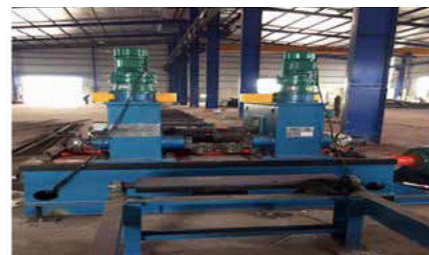
AUTOMATIC FLATTENING MACHINE 自動ビーム矯正機、