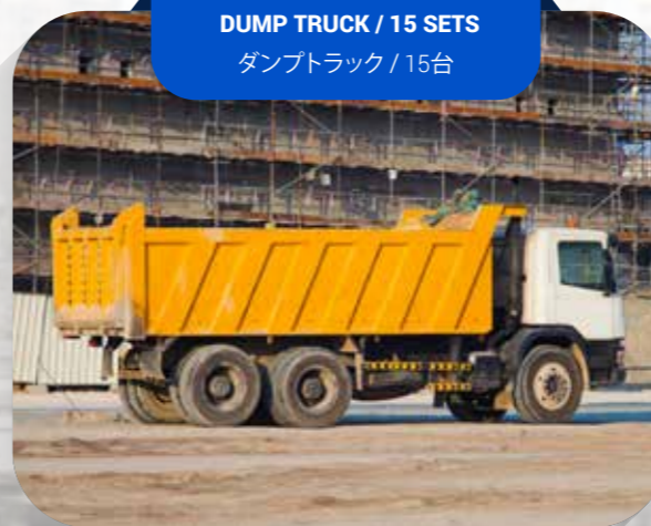
DUMP TRUCK / 15 SETS ダンプトラック / 15台