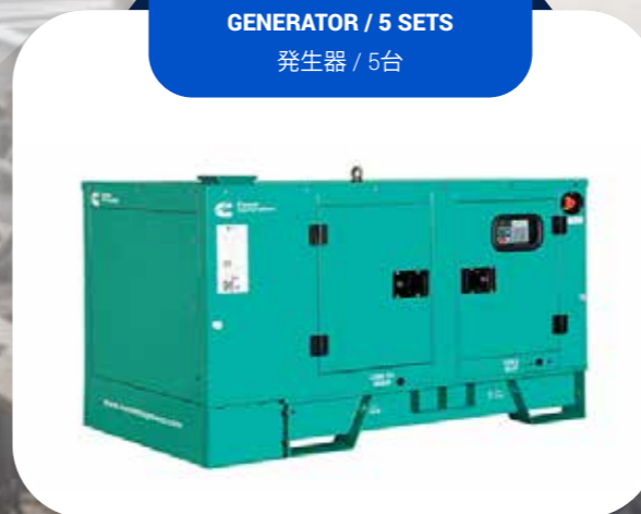
GENERATOR / 5 SETS 発電機 / 5台