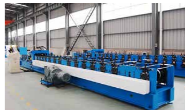
U, C, Z SECTION COLD FORMING MACHINE U、C、Z圧延機