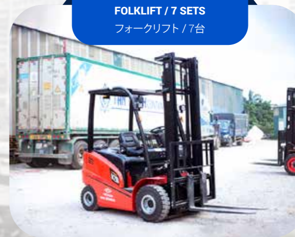
FORKLIFT / 7 SETS フォークリフト / 7台