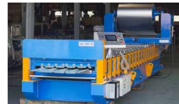
METAL SHEET COLD FORMING MACHINE ロール成形機