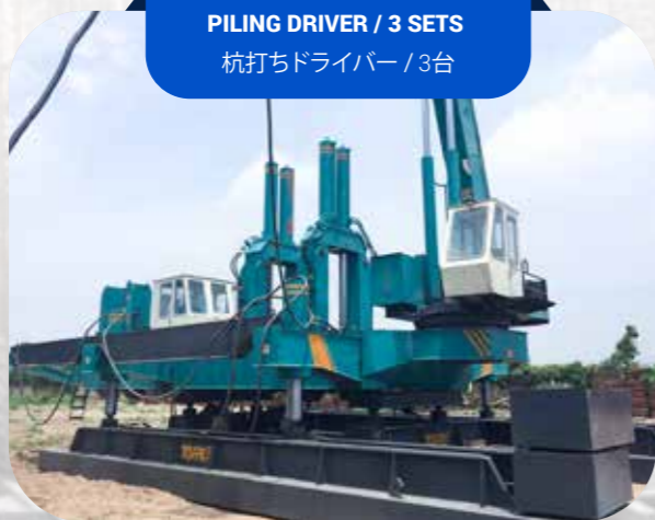
PILING DRIVER / 3 SETS 杭打ちドライバー / 3台