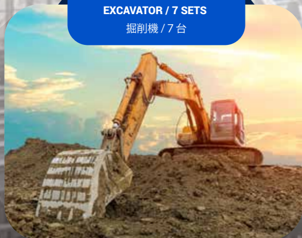
EXCAVATOR / 7 SETS 掘削機 / 7台