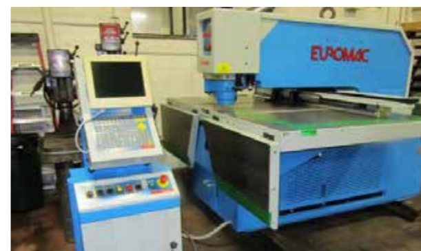
CNC CUTTER AND HOLE MAKING MACHINE CNCパンチングマシン