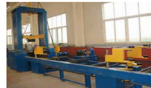
AUTOMATIC ASSEMBLE WELDING MACHINE 自動タック溶接機、