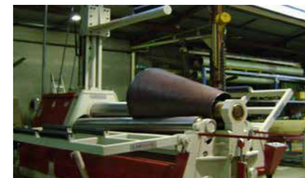
STEEL PLATE CURLING MACHINE 鋼板カーリング機