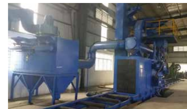
SAND BLASTING MACHINE サンドブラスト機